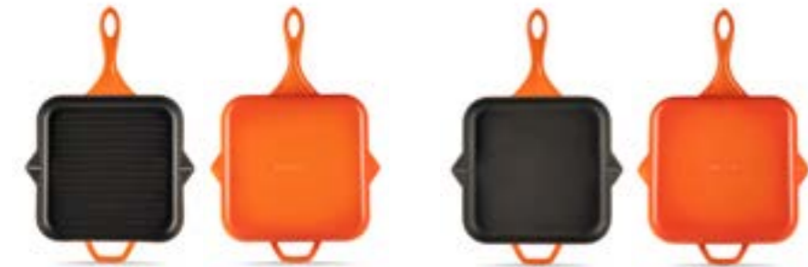
HS K GTV 28