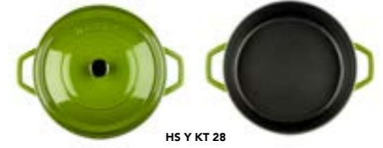
HS Y KT 28