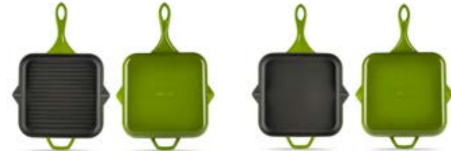
HS K GTV 28