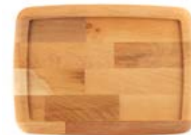
HS ST 2131 AH