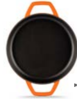
HS Y KTV 16 SH