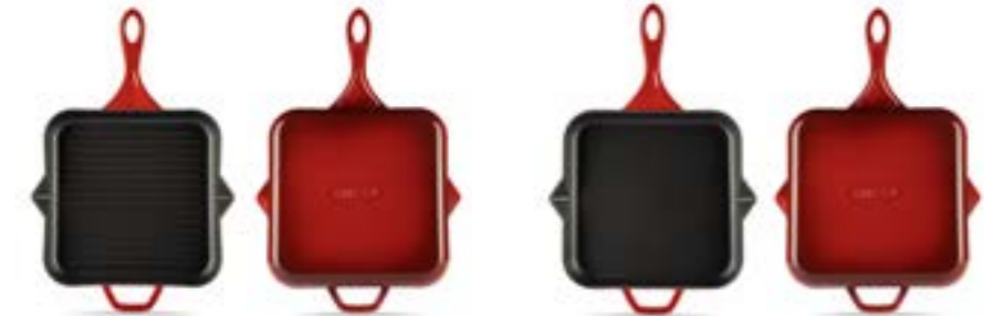
HS K GTV 2828