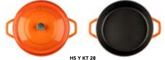
HS Y KT 28