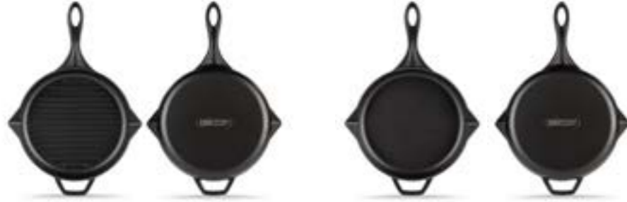
HS Y GTV 28