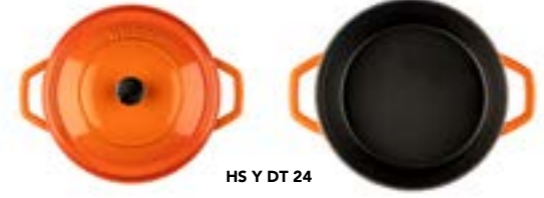
HS Y DT 24