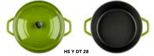
HS Y DT 28