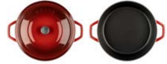
HS Y KT 28