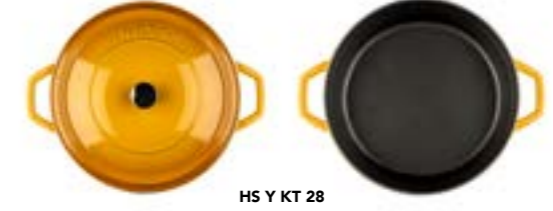
HS Y KT 28