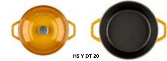
HS Y DT 20

Ürün Adı : Derin Tencere 20 / 24 / 28 Cm. Siğ Tencere 28 Cm.