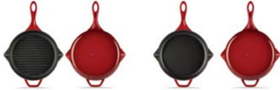
HS Y GTV 28