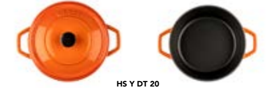
HS Y DT 20

Ürün Adı : Derin Tencere 20 / 24 / 28 Cm. Siğ Tencere 28 Cm.