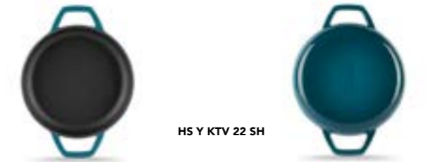
HS Y KTV 22 SH

Ürün Adı : Çift Kulplu Sahan 16 / 19 / 22 Cm.