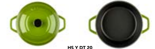
HS Y DT 20

Ürün Adı : Derin Tencere 20 / 24 / 28 Cm. Siğ Tencere 28 Cm.