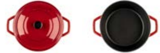
HS Y DT 24