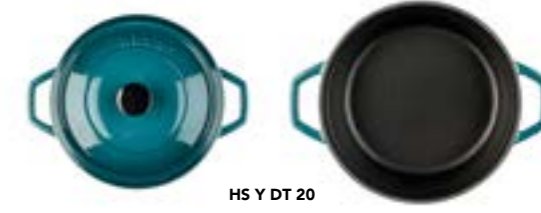
HS Y DT 20

Ürün Adı : Derin Tencere 20 / 24 / 28 Cm. Şığ Tencere 28 Cm.