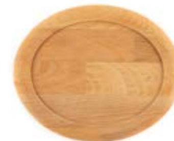
HS FT 1825 AH