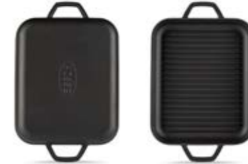
HS DD GTV 2632

Ürün Adı : Dikdörtgen Izgara Tava ve Fırın Kabı 26 x 32 Cm.