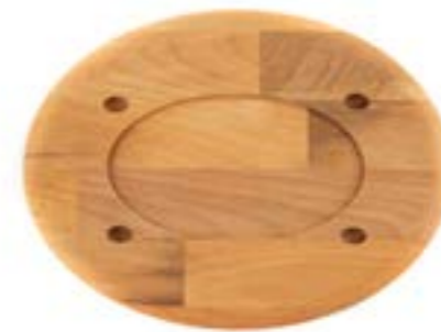
HS O İSK 1728 AH