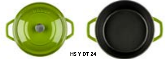
HS Y DT 24