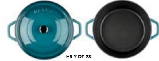
HS Y DT 28