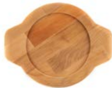
HS Y KTV 19 SH AH