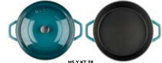
HS Y KT 28