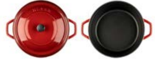
HS Y DT 28