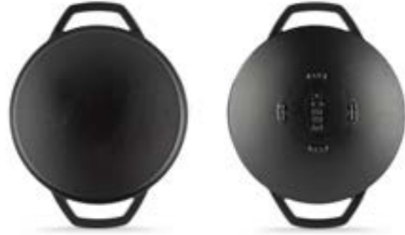
HS Y SAK 28