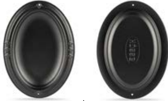
HS O İSK 2533