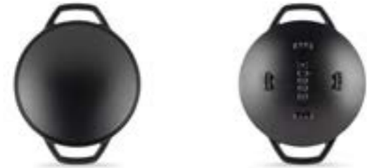
HS Y SAK 20

Ürün Adı : Sac Kavurma Tavası 20 / 28 Cm.