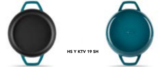
HS Y KTV 19 SH