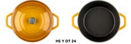
HS Y DT 24