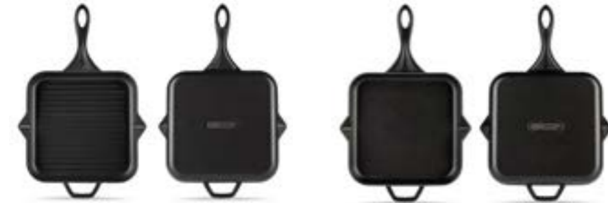
HS K GTV 28