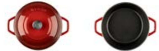
HS Y DT 20

Ürün Adı : Derin Tencere 20 / 24 / 28 Cm. Sığ Tencere 28 Cm.