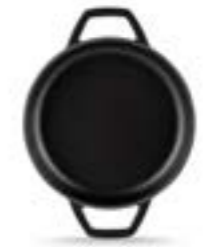
HS Y KTV 22 SH