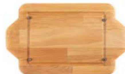
HS DD HP 1522 AH