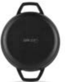
HS Y KTV 19 SH