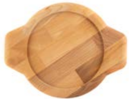
HS Y KTV 22 SH AH