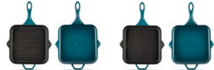
HS K GTV 28