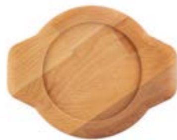
HS Y KTV 16 SH AH