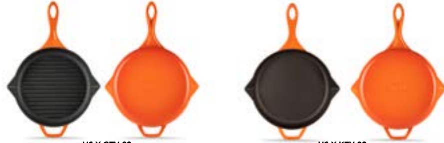
HS Y GTV 28