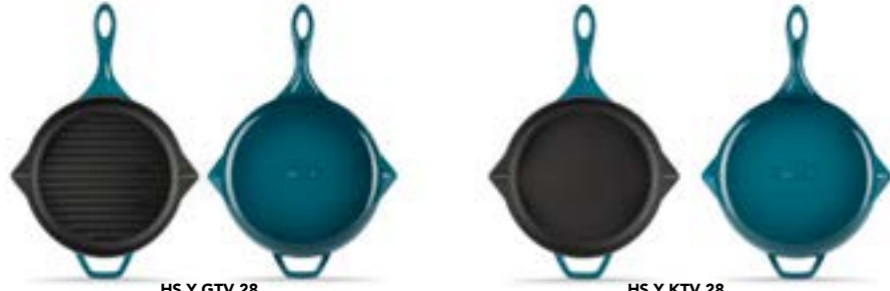
HS Y GTV 28