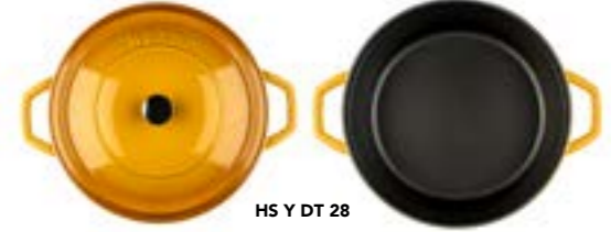
HS Y DT 28