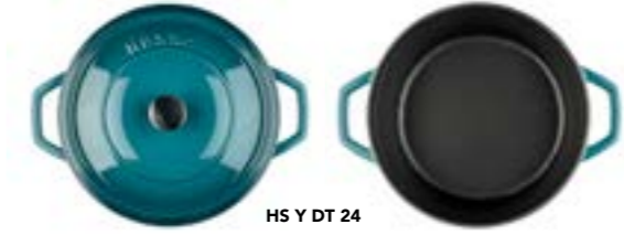
HS Y DT 24