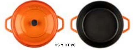
HS Y DT 28