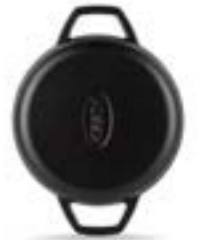
HS Y KTV 16 SH

Ürün Adı : Çift Kulplu Sahan 16 / 19 / 22 Cm.