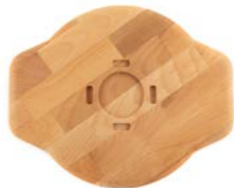
HS Y SAK 28 AH