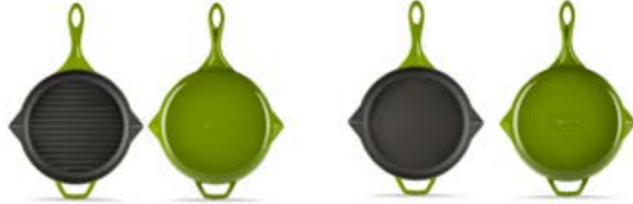
HS Y GTV 28