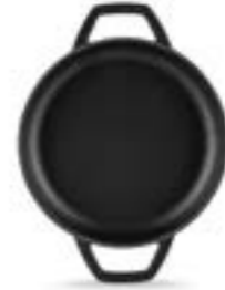
HS Y KTV 19 SH