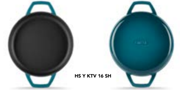
HS Y KTV 16 SH