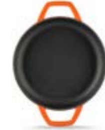
HS Y KTV 19 SH