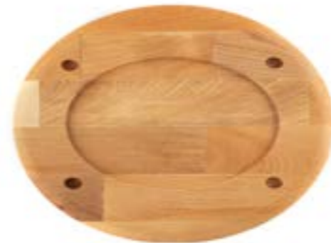
HS O İSK 2533 AH