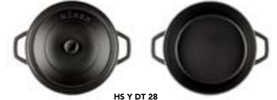
HS Y DT 28