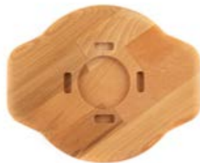
HS Y SAK 20 AH