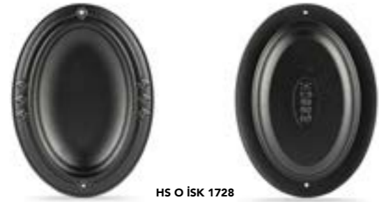
HS O İSK 1728

Ürün Adı : Oval İskender Tabağı 17 x 28 Cm. / 25 x 33 Cm.