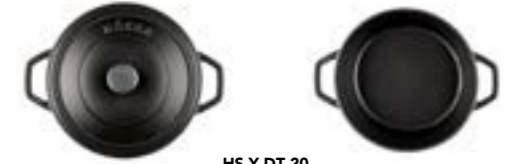
HS Y DT 20