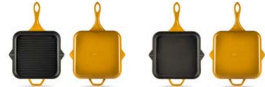
HS K GTV 28