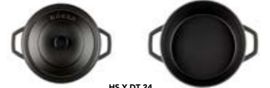
HS Y DT 24