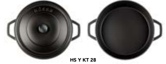
HS Y KT 28