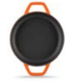
HS Y KTV 22 SH