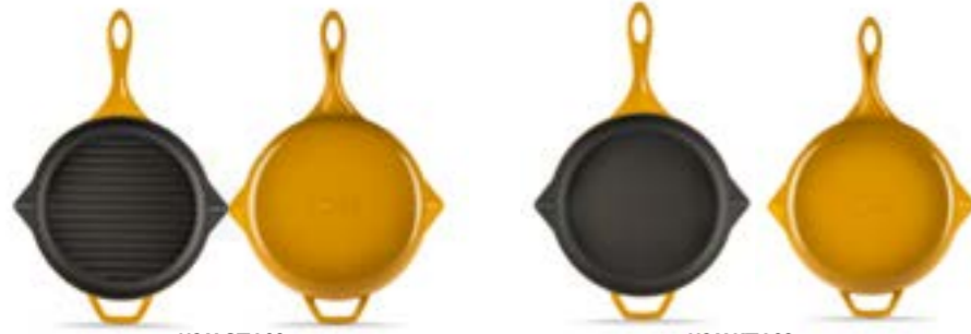
HS Y GTV 28