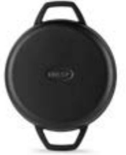
HS Y KTV 22 SH