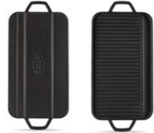
HS DD HP 2544

Ürün Adı : Büyük Griddle Izgara 25 x 44 Cm.