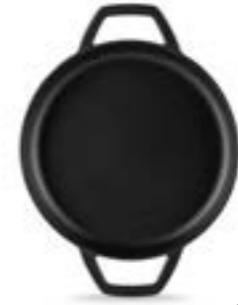
HS Y KTV 16 SH